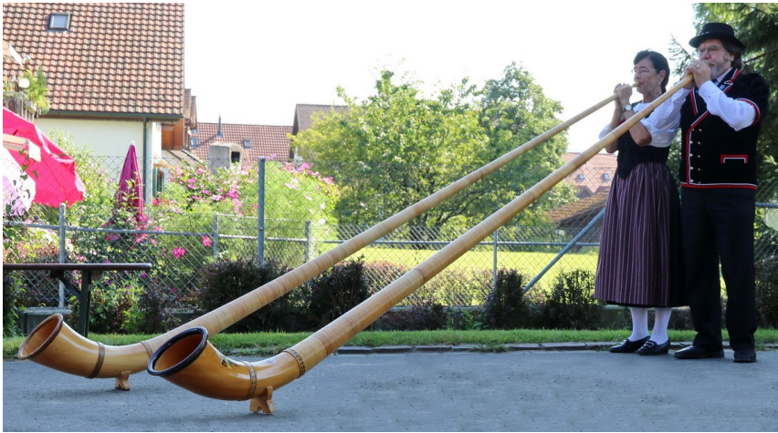
Impression aus dem Jahre 2016