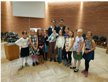
Gruppenbild vom Taufgottesdienst unter Mitwirkung der Drittklässlerinnen in der Kirche Niederglatt 2018

Für die Erwachsenen sind attraktive Gottesdienste, wenn die Kinder integriert und nicht als Störfaktor wahrgenommen werden. Als konkrete Umsetzungsformen wird Verschiedenes genannt wie kurze Predigt, mit Bildern arbeiten, die Kinder sind nur in einem Teil des Gottesdienstes dabei, aktuelle Themen, mehr Leute integrieren. Die Kinder und Jugendlichen/jungen Erwachsenen fragten wir, welche Gottesdienste ihnen noch in Erinnerung sind. Für die Kinder sind Abendmahl- und Untiabschlussgottesdienst in bester Erinnerung, weil sie mitgestalten durften. Einige Kinder erinnern sich auch an Gottesdienste, wo Geschwister oder Kusinen mitbeteiligt waren. Die Jugendlichen/jungen Erwachsenen erinnern sich an die Konfirmation, an aussergewöhnliche Gottesdienste oder Gottesdienste der Mitbeteiligung.