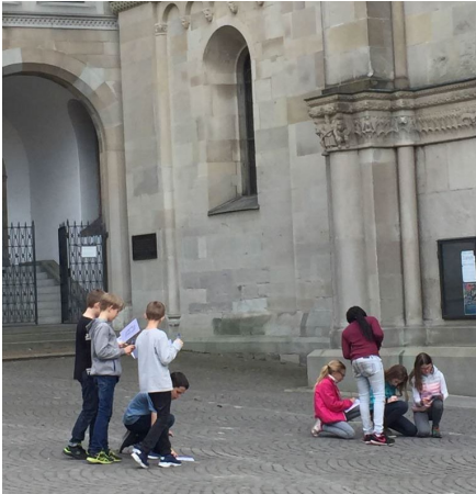
Ausflug der JuKi 5 «Auf den Spuren der Reformation»