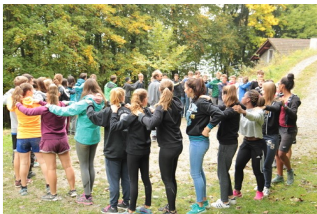
Gemeinschaft aus dem Konflager 2016

In einer angebotsüberfüllten Zeit sind wir herausgefordert, die Familien alltagsbezogen und bedürfnisorientiert zu erreichen und sie in Glaubens- und Lebensfragen zu begleiten. Um zu erfahren, ob wir auf dem richtigen Weg sind resp. was im Bereich der Kinder- und Jugendarbeit noch zu verbessern ist, haben wir Interviews geführt. Es wurden 50 Interviews geführt mit insgesamt ca. 115 Personen (inkl. Untigruppen als Interviewpartner). Drei verschiedene Fragebögen waren an die Zielgruppen Kinder (5 Jahre bis 7. Klasse), Jugendliche/junge Erwachsene (8. Klasse bis 25 Jahre) und Erwachsene (26 bis 80 Jahre) gerichtet.