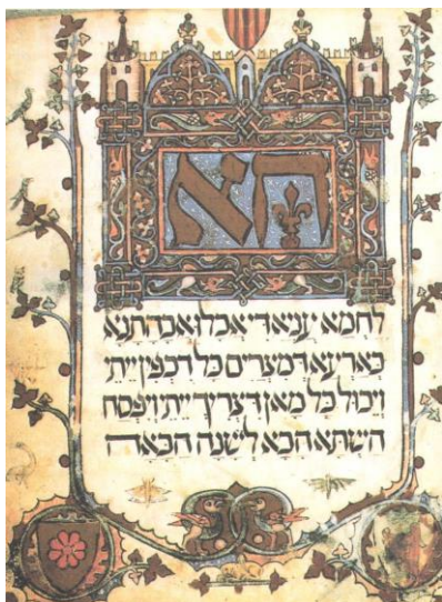
Textausschnitt aus der Haggadah von Sarajevo

Während meiner Zeit als Vertreter in unserer Gemeinde ist viel gesprochen, besprochen, diskutiert, hinterfragt, angeregt, abgewogen, ermutigt oder geklärt worden. In Behördensitzungen, Mitarbeiterbesprechungen, im Austausch in der Gemeinde und mit Menschen von aussen. Dazu sind mehrere 100 Seiten Protokolle, Konzepte, Pläne, Zahlen, Briefe, Gratulationen, Gesuche, Auswertungen, Unterrichtspräparationen und -unterlagen, Predigten, Reden, Entscheidungsgrundlagen usw. aufgeschrieben worden. Danach elektronisch oder auf Papier im Archiv, Ordner oder Papierkorb abgelegt. Manches davon wird wieder hervor genommen, gebraucht und weiterentwickelt oder gelebt.