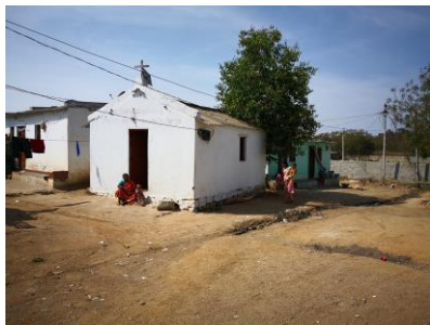
Kirche in einem Slum