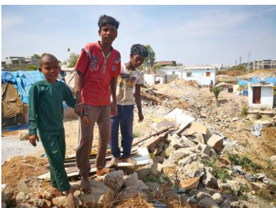
Kinder im Slum