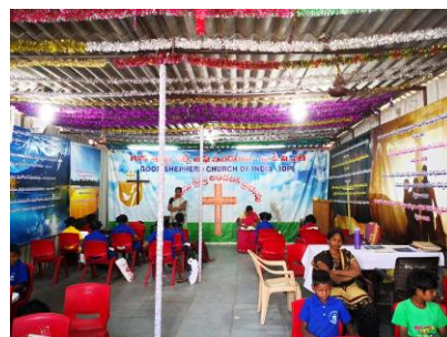
Slum Kirche und Schule