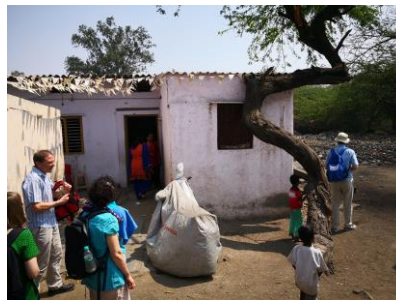
Schule in einem Slum