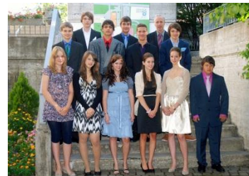
Konfirmandinnen / Konfirmanden aus Niederglatt